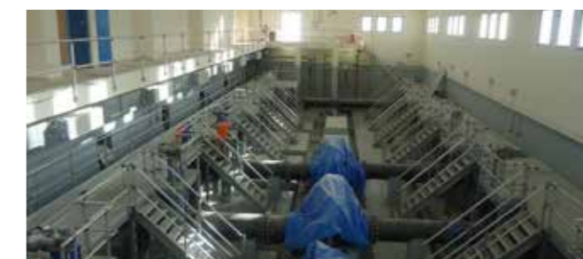
管接件与加工预制优势对比