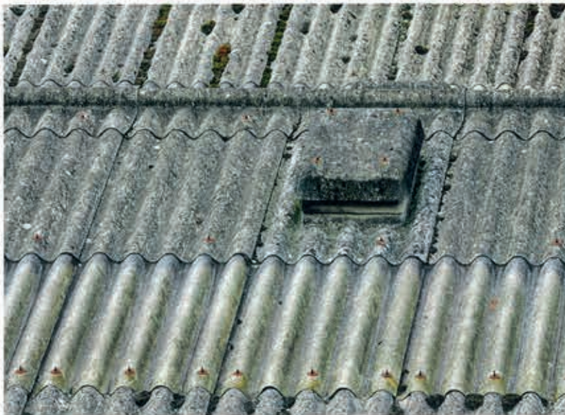
Ohne geeignete Sicherungsmaßnahmen eine tödliche Gefahr: Dächer mit Faserzementplatten

Reparaturarbeiten auf dem Dach einer Lagerhalle wurden dem Beschäftigten einer kleinen Firma zum Verhängnis. Weil keine Sicherungsmaßnahmen getroffen wurden, stürzte er ab und starb an schweren Kopfverletzungen. Sein Chef wurde wegen fahrlässiger Tötung verurteilt.