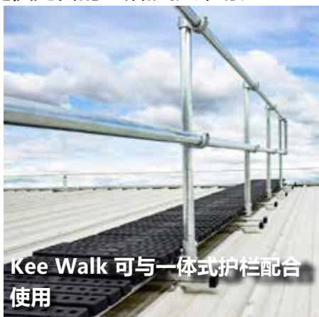
Kee Walk 可与一体式护栏配合使用