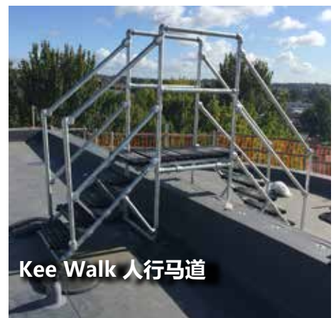
Kee Walk 人行马道